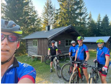
Asdølrunnen, her fra Myggheim